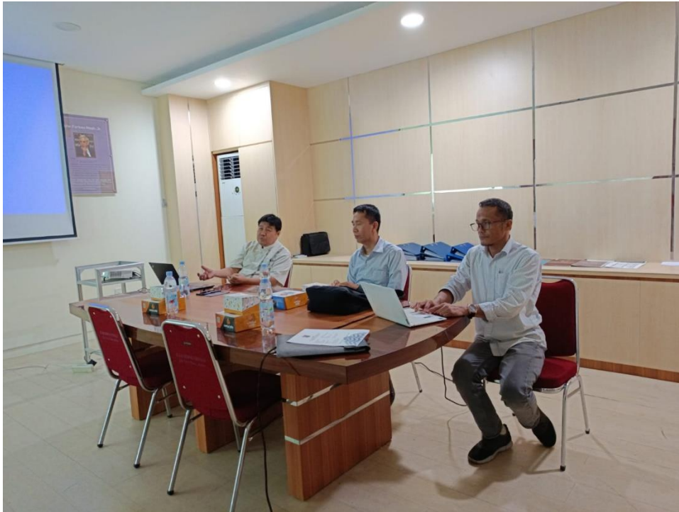
Foto Kegiatan AMI